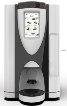
LEI SA RY TOUCH 7" FV