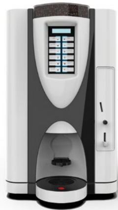
LEI SA RY EASY