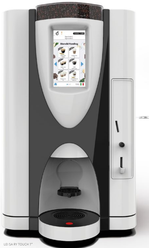
LEI SA RY TOUCH 7"

LEI SA RY, le distributeur semi-automatique OCS (Office Coffee Service) pour une offre café dans toutes ses déclinaisons de goût.