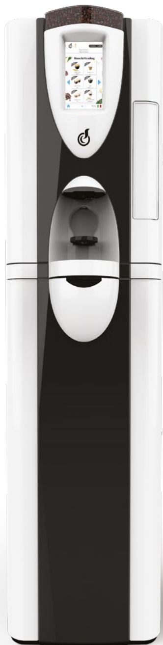
LEI SA RY TOUCH 7*