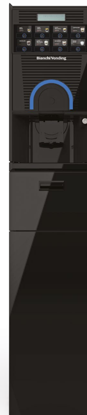
GAIA STYLE EASY + MOBILETTO

♡ Una pausa sicura è una pausa fatta di sorrisi: perché per godersi il momento ci vuole la giusta tranquillità.