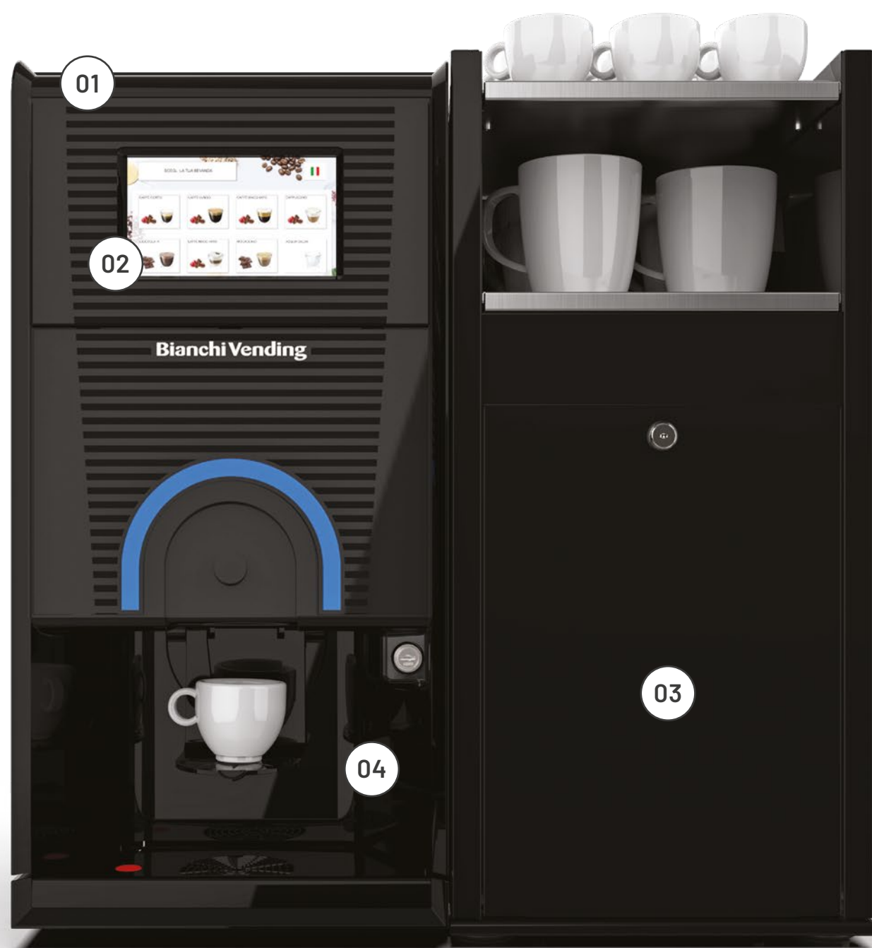
GAIA STYLE RY TOUCH 7" + MODULO FRESH MILK (opzionale)

Con Gaia Style Ry fai rinascere il piacere di stare insieme in ufficio, in negozio, in studio: una pennellata di design per rendere più piacevole l'atmosfera, un menu con tante opzioni possibili per avere tutta la libertà di scelta che desideri.