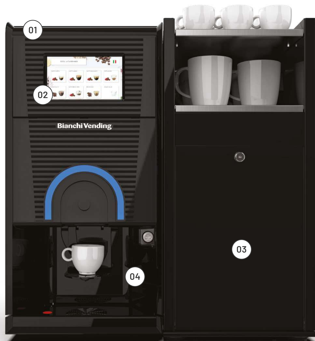
GAIA STYLE RY TOUCH 7" + MÓDULO DE LEITE FRESCO (opcional)

Gaia Style Ry renova o prazer da boa companhia no escritório, loja ou atelier: um elemento de design que torna o ambiente mais agradável, um menu com muitas opções possíveis que proporcionam toda a liberdade de escolha que sempre desejou.