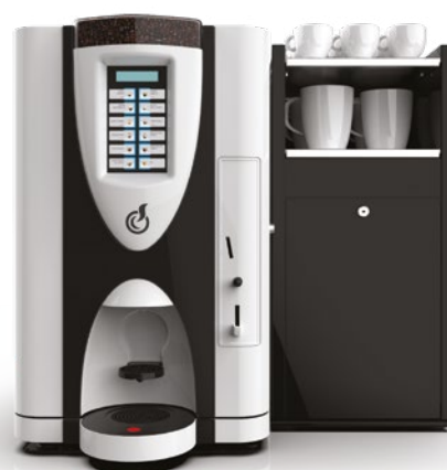
LEI SA RY EASY + MODULO FRESH MILK (accessorio in opzione)

LEI SA RY, distributore semi automatico OCS (Office Coffee Service) per offrire il caffè nelle sue molteplici declinazioni di gusto.